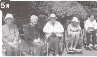
大妻高校野点招待