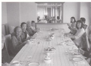
国際ホテルでちょっときどって、ランチをしました。