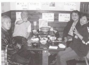
ちよつと一杯!!夜、居酒屋へ行きました。