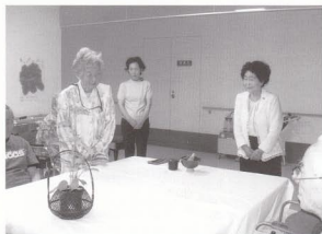
ボランティアの方とお茶のお手前。皆ちよつと緊張気味です。