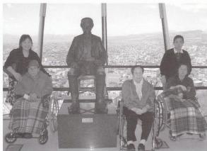
花見を兼ね、新観光名所五稜郭タワー見学。