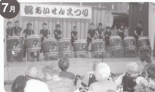
あいせんまつり 巴太鼓。ダイナミックでした。