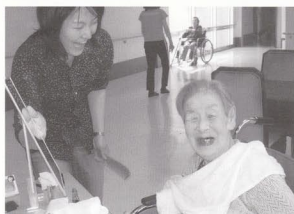
化粧隊訪問。美しく化粧してもらいました。うれしいなあ。