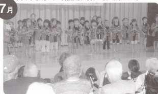
あいせんまつり 亀田保育園よさこいソーラン。元気で可愛かった。