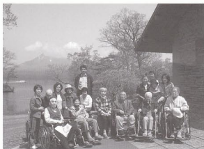
胸ヶ岳をバックにハイ、チーズ。