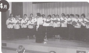
高齢者大学コーラス訪問