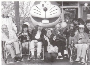
大沼公園で皆でピースだよ。