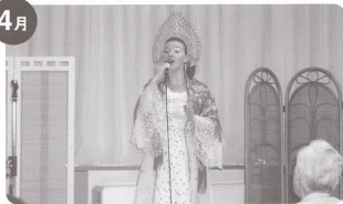
ロシア民謡をうたう