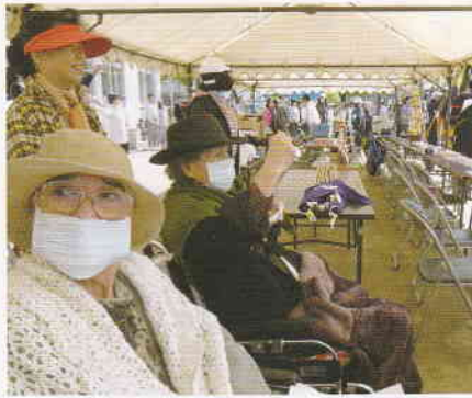
6月 中島小運動会 みんながんばれ～!