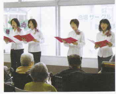
6月 合唱サークル訪問 演奏会 楽しいひとときでした