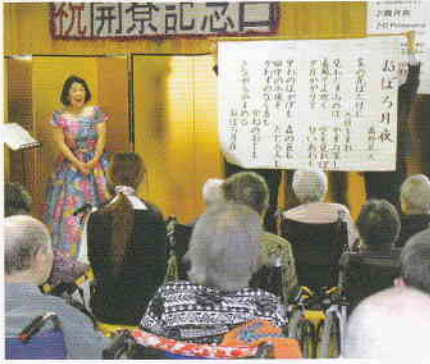
4月 開寮記念日 ♪ あーいせーんりょうー