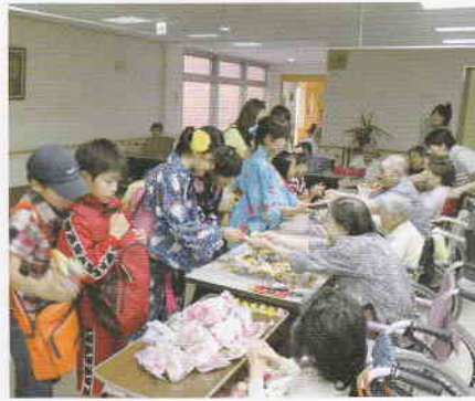
7月 七夕 ♪ たけーにたんざくー