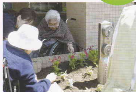
ひと株ひと株ていねいに

愛泉寮の正面玄関に、色とりどりの花を植えました。ひとときでも、みなさんの目を楽しませることができれば幸いです。