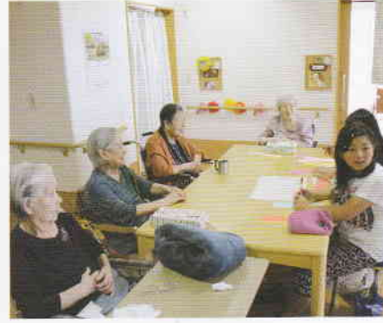
7月 七夕短冊書き 願い事がかないますように