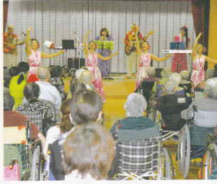
2月 ハワイアン 華やかなひとときでした