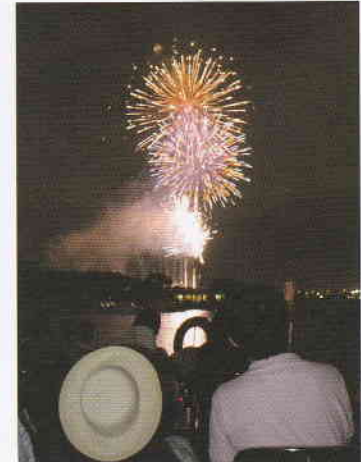
7月 花火大会 たぐまや?