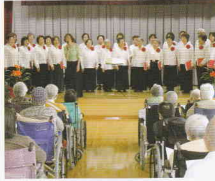
4月 函館市高齢者大学 コーラス部訪問 みんなで歌いました