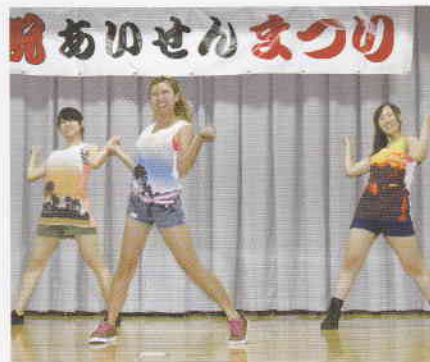
7月 あいせんまつり 公立はこだて未来大学 cheer☆dance部