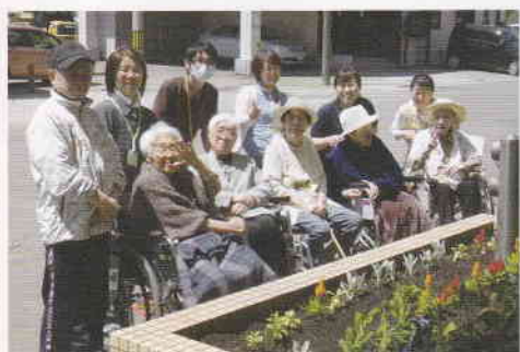
きれいに咲きますように

愛泉寮の正面玄関に、色とりどりの花を植えました。ひとときでも、みなさんの目を楽しませることができれば幸いです。