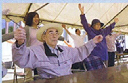
6月 中島小学校 運動会応援 応援前に一緒にラジオ体操