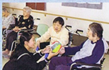
6月 遺愛中学校との交流 ゲームや昔の遊びで 盛り上がりました