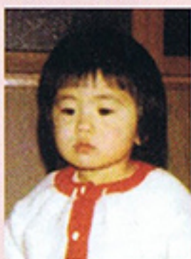
声が低い女性です(笑)