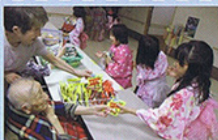
7月 七夕 かわいいお客様にニコリ！！