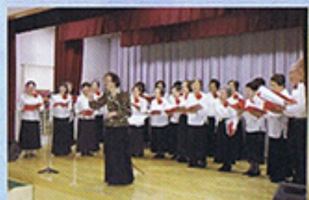
4月 函館市高齢者大学 コーラス部訪問 みんなで大合唱♪