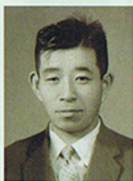
施設内をいつも散歩しています。