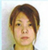
介護職員 フクロウユニット しながわにいな

愛泉寮に入職し、早くも四ヶ月が経ちました。まだまだ至らない点も多々ありますが、皆様の支えの中、毎日楽しく経験を積ませていただいております。明るく元気に頑張りますので、宜しくお願い致します。