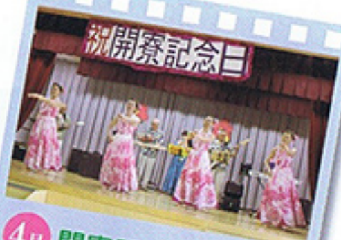
4月 開寮記念日 ファイブエコース& マイル本間星川教室