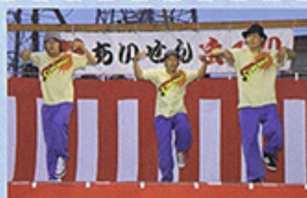
7月 あいせんまつり 北海道教育大学 ダンスクラブBee