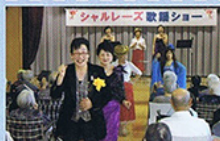
6月 シャルレーズ 歌謡ショー 素敵なお声がかきました♪