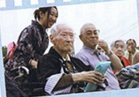
7月 あいせんまつり 宝くじが当たりました！