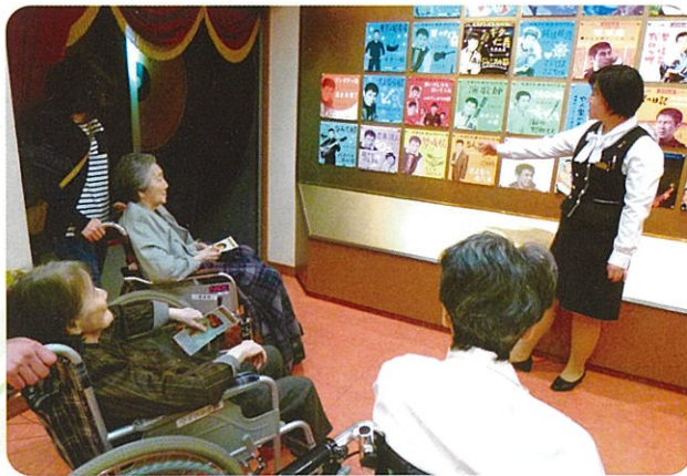
北島三郎記念館を見学しました