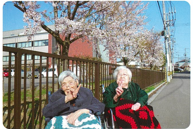
施設周辺で桜鑑賞です