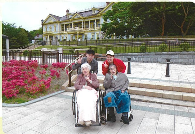
旧函館区公会堂を散策しました