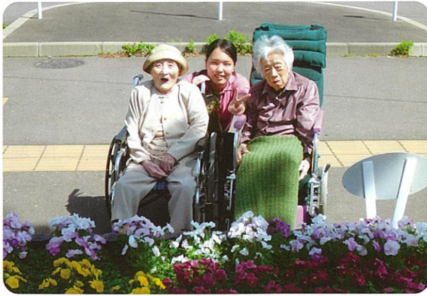
花が綺麗に咲いてちょうど見頃の時期でした