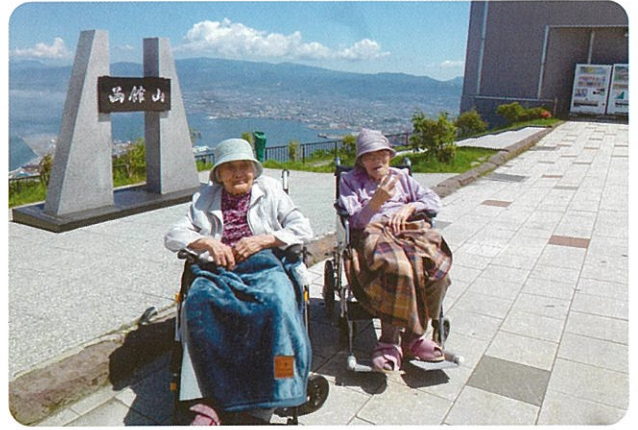
晴天に恵まれました。まさに絶景!