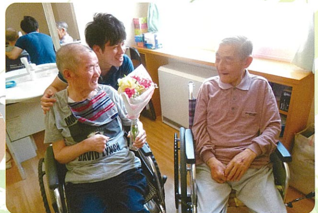
誕生日をお祝いしました