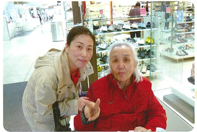
デパートショッピングを楽しみました