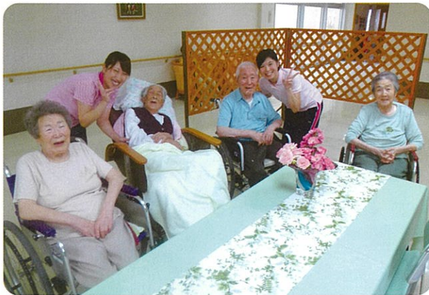
職員と一緒に「ハイ、チーズ」