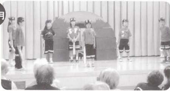
訪問による中島小学校学芸会 中島小学校児童の熱演。拍手にも力がこもりました。