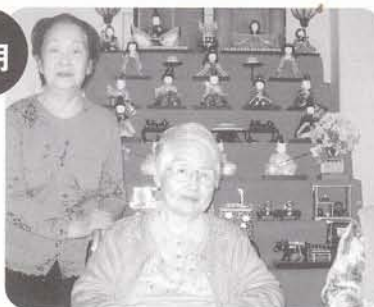
ひなまつり おひな様と一緒に。