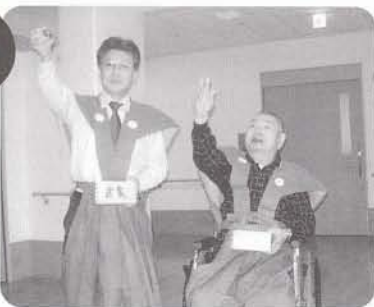
豆まき 鬼はそと、福はうち!!