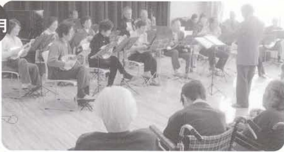
マンドリン演奏会 マンドリンのメロディーによって高原列車は行くを皆で唄いました。