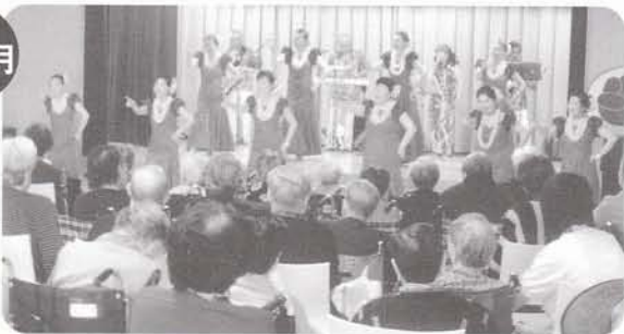
ハワイアン&フラコンサート 常夏ムードを満喫しました。