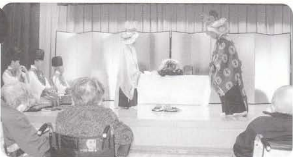
新年交礼会 松前神楽で新年を祝いました。