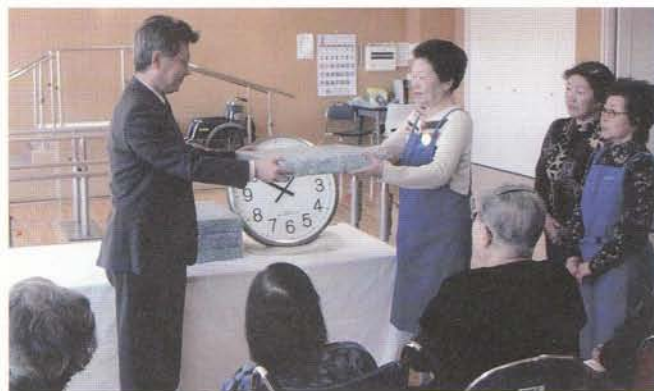
ボランティアあじさいグループより電波時計を寄贈していただきました。