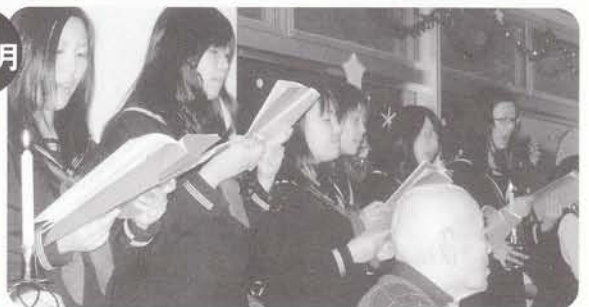
遺愛女子高校キャロリングの訪問 クリスマスのキャロリング。美しいメロディーにクリスマス気分満喫!