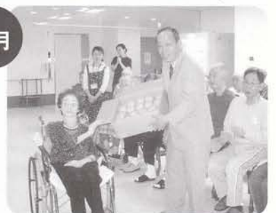
奈良県JAより柿の寄贈式 感謝!!