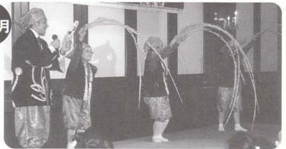
ボランティア交流の集い ボランティアの皆様へ感謝を込めて集いました。