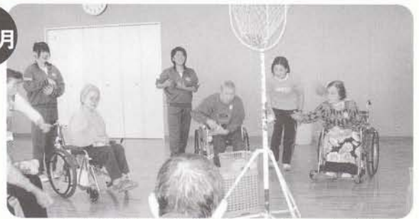
北中学校総合学習「入居者との交流」 中学生とゲーム等で交流。楽しいひとときをすごしました。