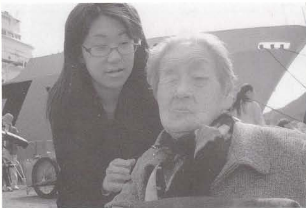
函館ドックの進水式に参加しました。