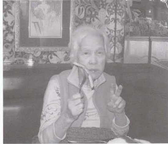
ラッキーピエロで美味しいよ。