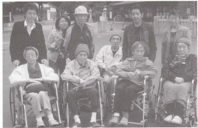
皆で外出楽しいなあ。