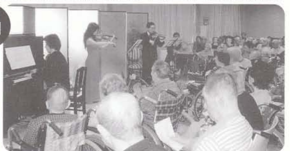
N響OB大松様演奏会 バイオリンとピアノの美しいメロディーすてきでした。