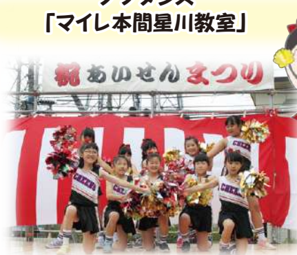
ヒップホップ・チア・ジャズダンス 「M-claps Dance class」