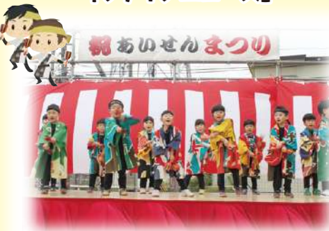
太鼓・よさこい「つくし認定こども園」