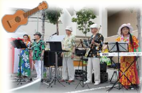
ハワイアン 「ファイブエコーズ」