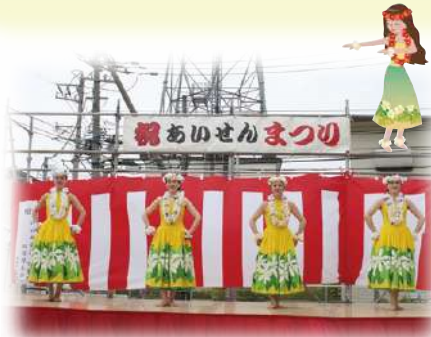
フラダンス 「マイル本間星川教室」