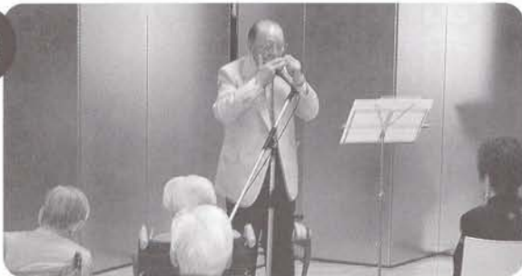
開寮41周年記念行事 なつかしいメロディーをハーモニカにのせて!!