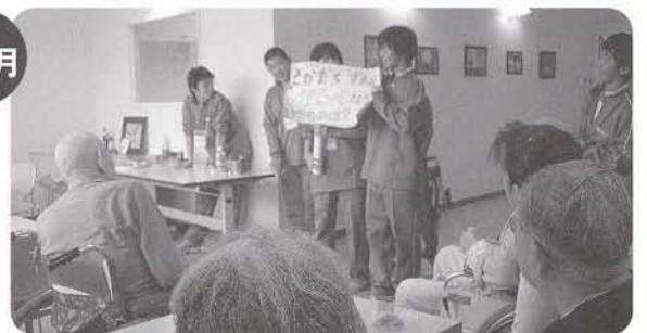
的場中学校総合学習 的場中学校の学生とゲーム等で楽しくすごしました。