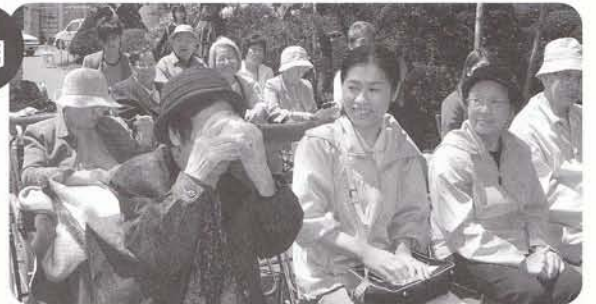
大妻高校「春の野点」 満開のさくらの中の野点でした。