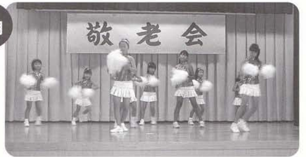
敬老会 エアロダンスサークルなどの多彩な催し物で秋の一日を満喫!!