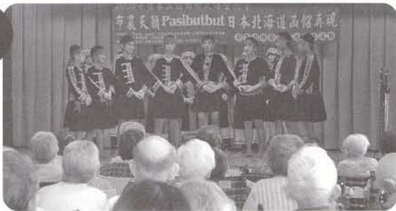
海外アーティストによる舞踊と音楽 アジアの民族舞踊、エキゾチックなリズムを楽しみました。