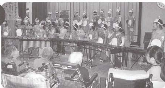
中島小学校児童学芸会 歌、器楽、劇と中島小学校の児童の学芸会を再演してくれました。