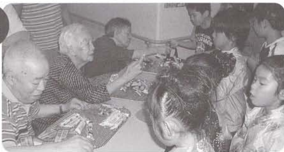
七夕まつり たくさんの地域の子もたちが来てくれました。