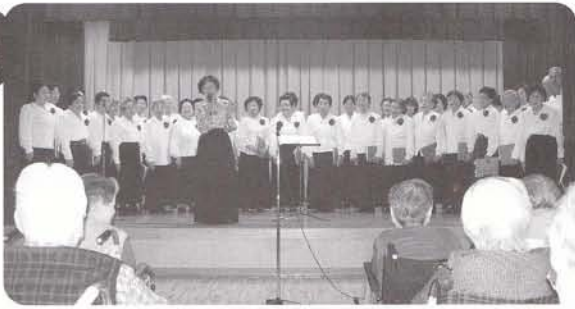
高齢者大学コーラス部 美しいハーモニーと若々しいリズム!!