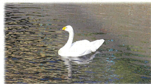
オオハクチョウ (傷を負っている為、渡りが出来なくなりました)

春・・・桜、つくし、フキ、白詰草、ウグイス 夏・・・どんごい(イタドリ)、猫じゃらし、カモメ 秋・・・コスモス、栗の木、トンボ、サギ