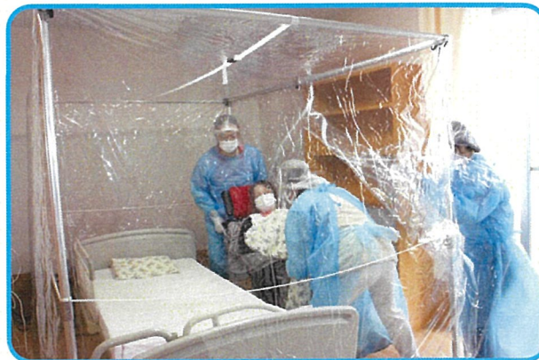
二次感染を防ぐテント式の簡易陰圧機の設営

愛泉寮では、次亜塩素酸ナトリウム液やエタノールでの消毒、職員によるプライベートでの行動の自制等、施設内にコロナウイルスを持ち込まないための対策を日々徹底しています。万が一に備えて実践的なシミュレーション(訓練)等も定期的に行っています。