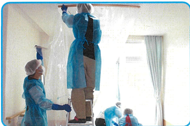
ビニールカーテン設置等