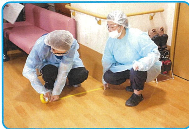
ユニット内汚染区域、清潔区域の区分け