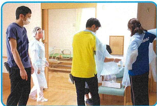
ガウン、マスク、フェイスシールド着用